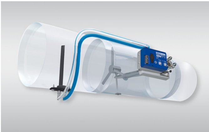
Ideal für Sanierungen: Das VAV-EasySet Ideal for refurbishment: The VAV EasySet

TROX unterstützt Anlagenbauer und Architekten bei Sanierungen mit einer umfangreichen Palette von Komponenten, die speziell für Sanierungszwecke entwickelt wurden.