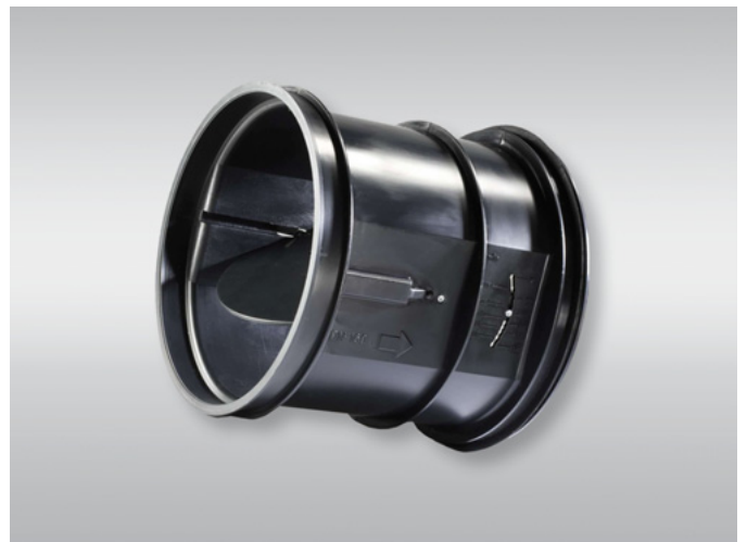
Einfache Installation: das Volumenstrom-Regelgerät VFL Easy installation: The volume flow control unit VFL

VAV-EasySet ist ein kompletter Bausatz aus regelungstechnischen Komponenten für die Sanierung von Volumenstrom-Regelgeräten. Und auch die Volumenstrom-Regelgeräte der Easy-Serie und VFL sind hervorragende Lösungen bei Sanierungsaufgaben. Sie können ebenso ganz einfach nach Nenndurchmesser ausgewählt werden. Die einfache Einstellung der Volumenströme auf der Baustelle spart Kosten bei Planung, Installation und Inbetriebnahme.