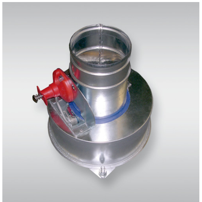
Objektspezifische Sonderlösung: Brandschutzklappe FKRS in Vorbauausführung Customised special solution: Fire damper FKRS for wall-mounting installation

Bei frühzeitiger Einbindung in die Planung kann TROX optimierte Lösungsansätze und individuelle Einzellösungen entwickeln, mit denen sich die gesteckten Ziele preiswerter und effizienter erreichen lassen. Für alle Fragen rund um das Thema Sanierung finden Sie bei TROX einen kompetenten Ansprechpartner, der Ihnen hilft, ein kostenoptimiertes Gesamtkonzept für höchste Kundenanforderungen zu erstellen und umzusetzen.